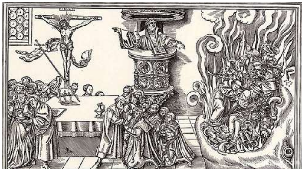
Lucas Cranach el Joven (+1586)

viene exigida por el elogio «eclesialmente correcto» de Lutero y de su Reforma en su Vº centenario.