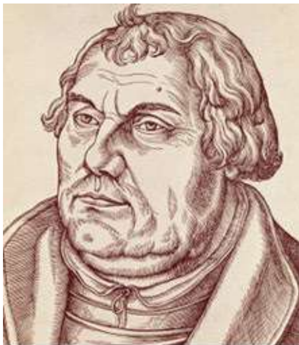
Lucas Cranach el Viejo (+1553)

Yo también, con la ayuda de Dios, expondré Sed contra la verdad de la Iglesia. Puede afirmarse que en el tiempo presente, «todo el mundo yace bajo el poder del Maligno» (1Jn 5,19), «padre de la mentira» (Jn 8,44),y que por tanto la verdad siempre ha de ser afirmada «sed contra» los pensamientos más comunes entre los hombres.